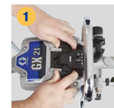
1 Csúsztassa el és nyissa fel a fedelet