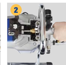
2 Vegye ki a szivattyúegységet