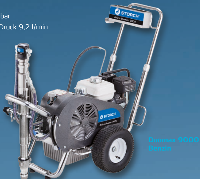
Duomax 9000 Benzin