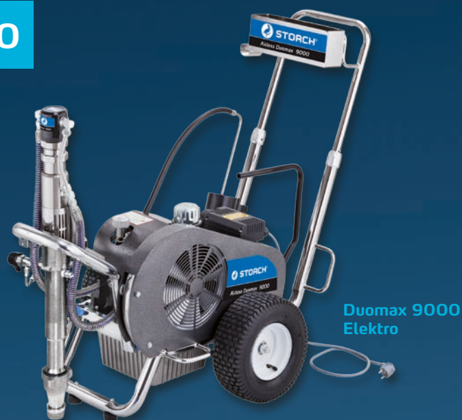
Duomax 9000 Elektro